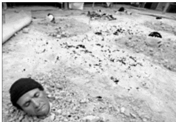
Figura 1. Se entierran y ayunan en protesta por la marginalidad.

completar doce personas enterradas, entre las que se contaron dos mujeres y tres estudiantes. Los representantes de 61 juntas de acción comunal de la localidad permanecieron día y noche al lado de sus compañeros ( El Tiempo , 12 de junio de 2002). Protestaban por la marginalidad en la que permanecían más de quince barrios de la denominada periferia sur de Bogotá: El Bosque y otros más ubicados en el borde oriental de la vía al Llano.